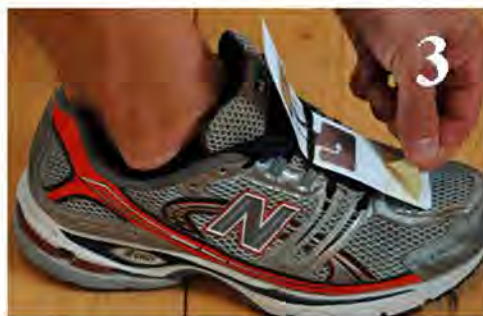
Rimuovere la pellicola gialla