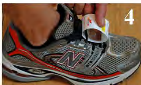
Attaccare le parti dove indicato