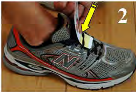
Passare il Chip sotto i lacci