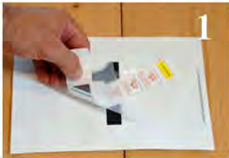
Rimuovere il Chip dal pettorale